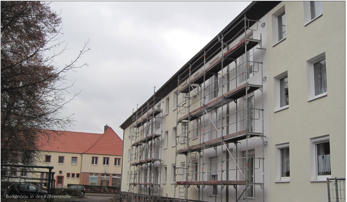
Balkonbau in der Köhlerstraße

Neben der Neubaumaßnahme Rolandstraße 12a (ehemaliger Spielplatz) galt das Interesse der WBG „Roland“ auch in diesem Jahr den Investitionen in den Bestand. Zu den größeren Baumaßnahmen gehörte die Neugestaltung der Fassade und Eingangsbereiche am Waldring 83 bis 87. In der Rolandstraße 2 bis 12 wurden neue Stellplätze geschaffen und 5 Kellereingänge grundlegend saniert. Die Rottmeisterstraße 19/21