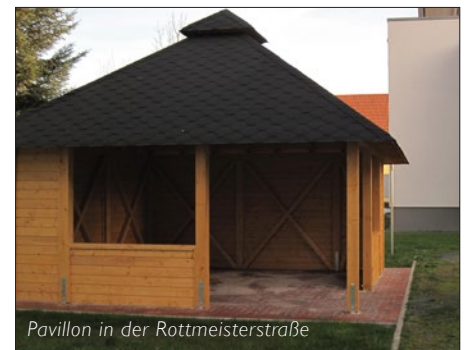
Pavillon in der Rottmeisterstraße

Ein weiterer Kostenfaktor sind auch die Wiederherrichtungen von Wohnungen sowie die Modernisierungen von Bädern. Auf diese Maßnahmen wird bereits seit Jahren ein Hauptaugenmerk gelegt.